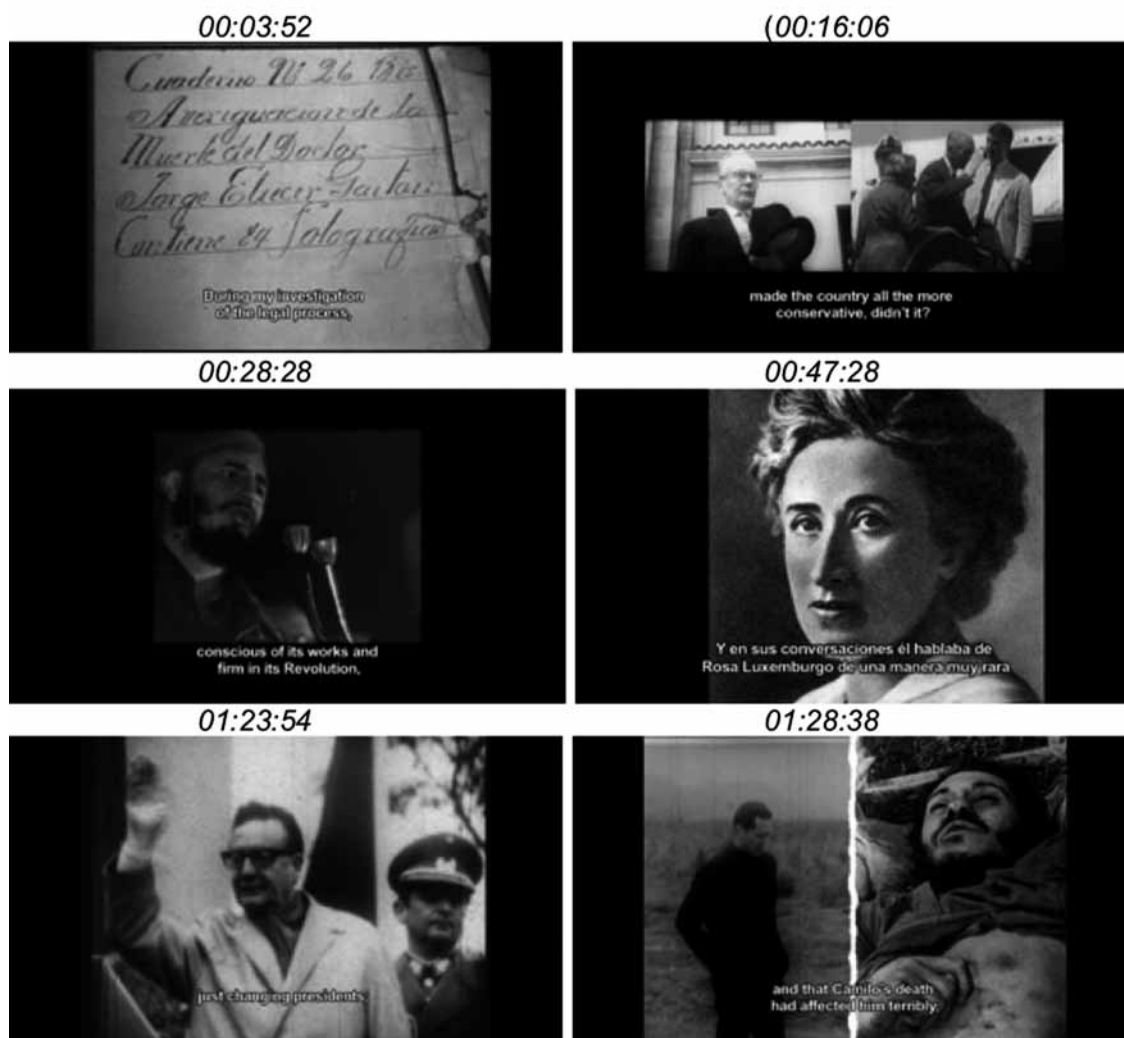
Figura 4: Algunos personajes históricos de Un tigre de papel .