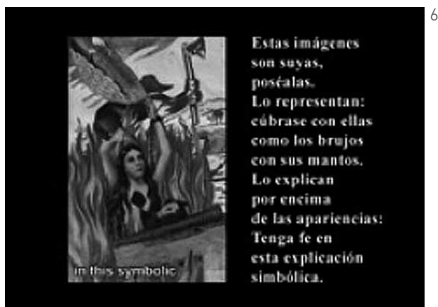
Figura 6: Ironía compuesta por collage y cita.

Una buena cantidad de collages actúan como digresiones, epífrasis, citas sueltas, pausas o transiciones entre fragmentos temáticos. Los que se atribuyen a Pedro Manrique Figueroa se caracterizan por la ironía irreverente y el eclecticismo ideológico-cultural de su iconografía (Figura 6). Y es la propia naturaleza descontextualizadora del collage la que provoca la reflexión sobre los iconos que lo componen.