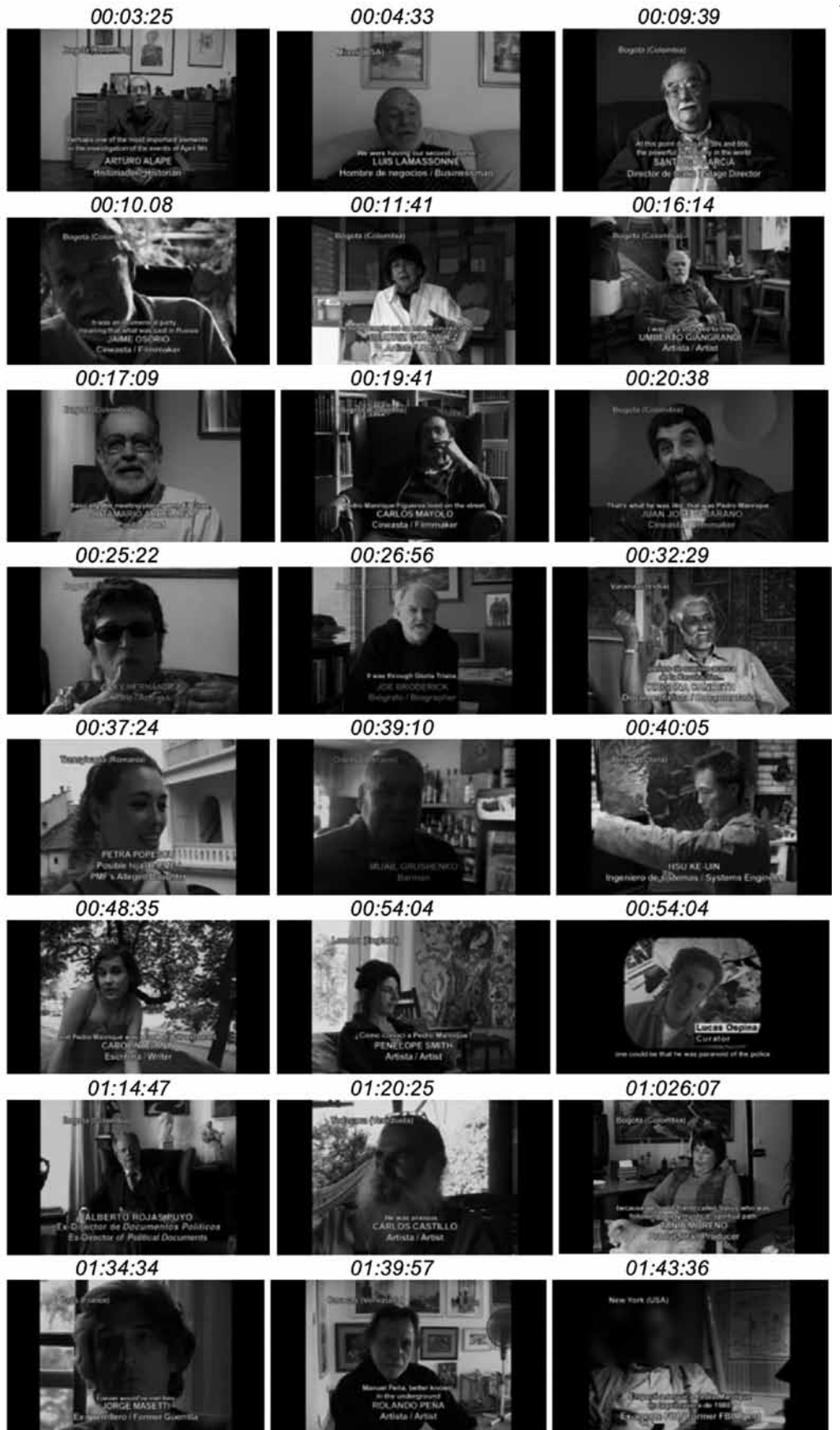
Figura 1: Collage de personajes de Un tigre de papel , con indicación de su momento de aparición en la estructura.