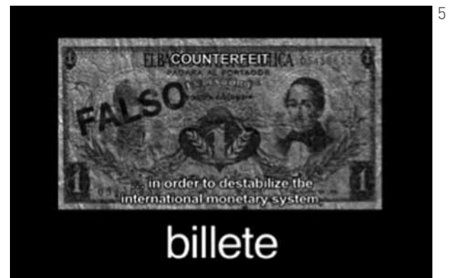
Figura 5: Metáfora compuesta por billete y escritura, relativa también a la propia naturaleza Un tigre de papel .

Del mismo modo como el personaje falso es una metáfora de nosotros, muchos contenidos de una gran parte del discurso son falsificaciones o alusiones a la falsificación, a tono metafórico con el personaje y con el falso documental que es Un tigre :