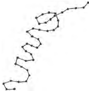
FIGURA 3. LÍNEA CONECTORA.