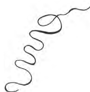
FIGURA 4. LÍNEA TRAZO.

Para graficar y poder entender esto, Ingold logra construir un idea basada en la semejanza de estas trayectorias a líneas, en la cual, básicamente hay dos tipos. El primer tipo son las llamadas conectoras 68 que se forman al enlazar una sucesión de puntos; el segundo tipo de líneas, son los trazos 69 ,