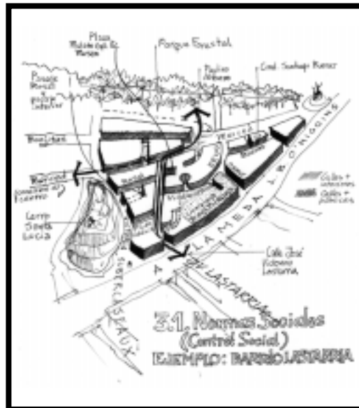
Dibujo 1: Barrio Lastarria

Un ejemplo local que traduce, a nuestro parecer, dicha configuración, es lo que podemos encontrar en el Barrio Lastarria (► DIBUJO N° 1) en la comuna de Santiago, que comprende las manzanas al interior de Alameda, como límite sur, el complejo Diego Portales como límite oriente, Merced como límite norte y Victoria Subercaseaux como límite al poniente y cuyos ejes principales son justamente la calle Lastarria, con mucho movimiento peatonal a toda hora y Rosal y Villavicencio con un flujo levemente menor, combinándose de este modo mucho movimiento