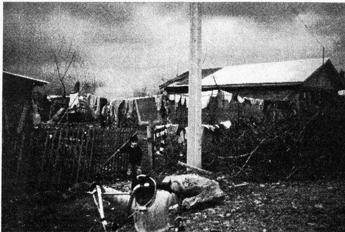
Villorio Julian Bajo la modalidad de autoconstrucción y emplazamiento independiente.