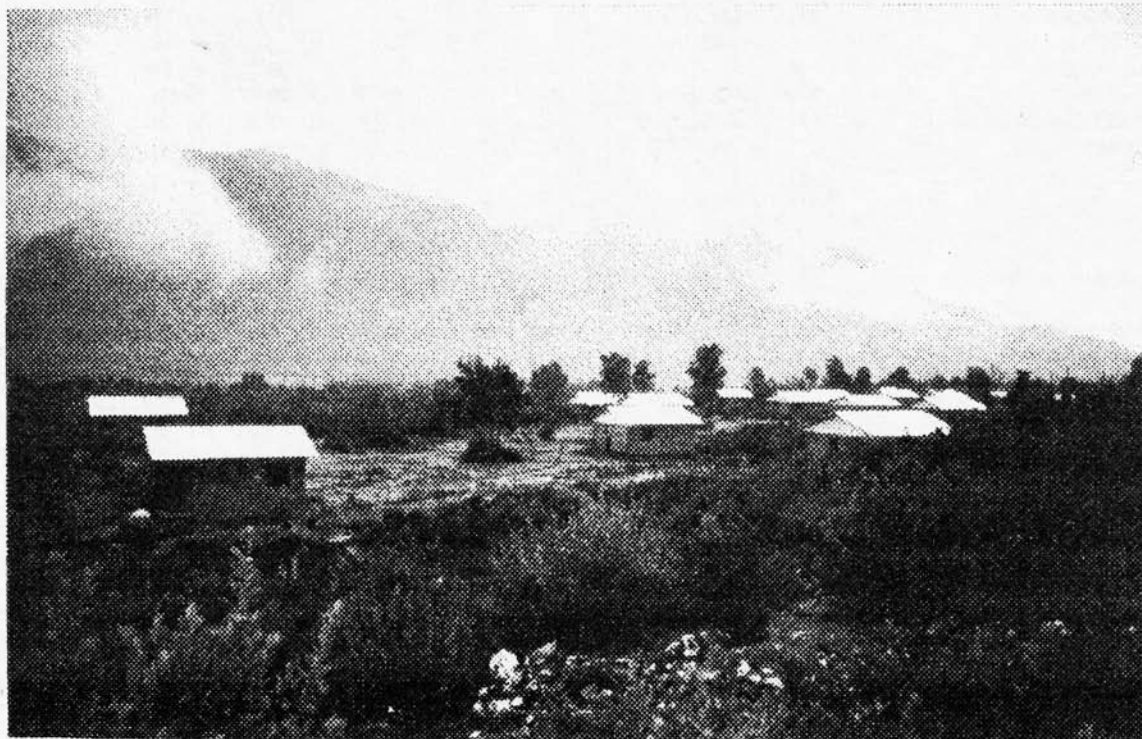
Potrero Grande Parte de un conjunto de 3 villorios que considera infraestructura urbana básica.