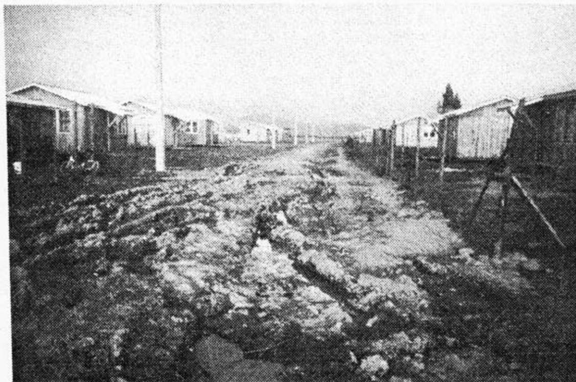
Villorio La Obra

Destaca por materiales de construcción en madera. Se observan evidencias de inundaciones en invierno.