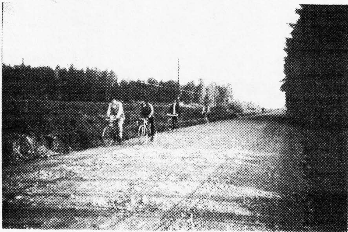
Trabajadores en bicicleta que se desplazan desde su lugar de residencia al trabajo diariamente.

- La distancia a centros poblados de mayor jerarquía es especialmente grave cuando el Villorrio presenta deficiencias en su dotación de Servicios y Equipamiento, como en Salud y