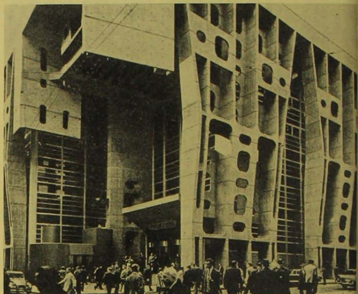
BANCO DE LONDRES Y AMERICA DEL SUR EN BUENOS AIRES

Década Mundial del Diseño Científico. Una síntesis de la propuesta presentada por Buckminster Fuller en los Congresos de la U.I.A. del 61 y 63. La propuesta de Fuller consiste en que "todas las Escuelas de Arquitectura del mundo cooperen en un programa de diez años de duración consagrado a la investigación y